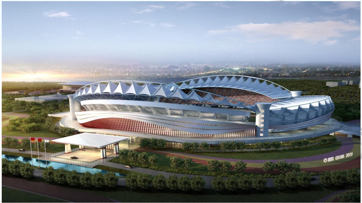
武汉体育中心 VIP 改造项目（第七届世界军人运动会主场馆）