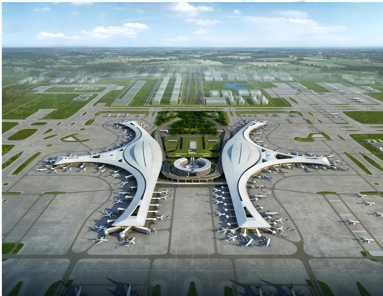
成都天府国际机场 T1 航站楼项目