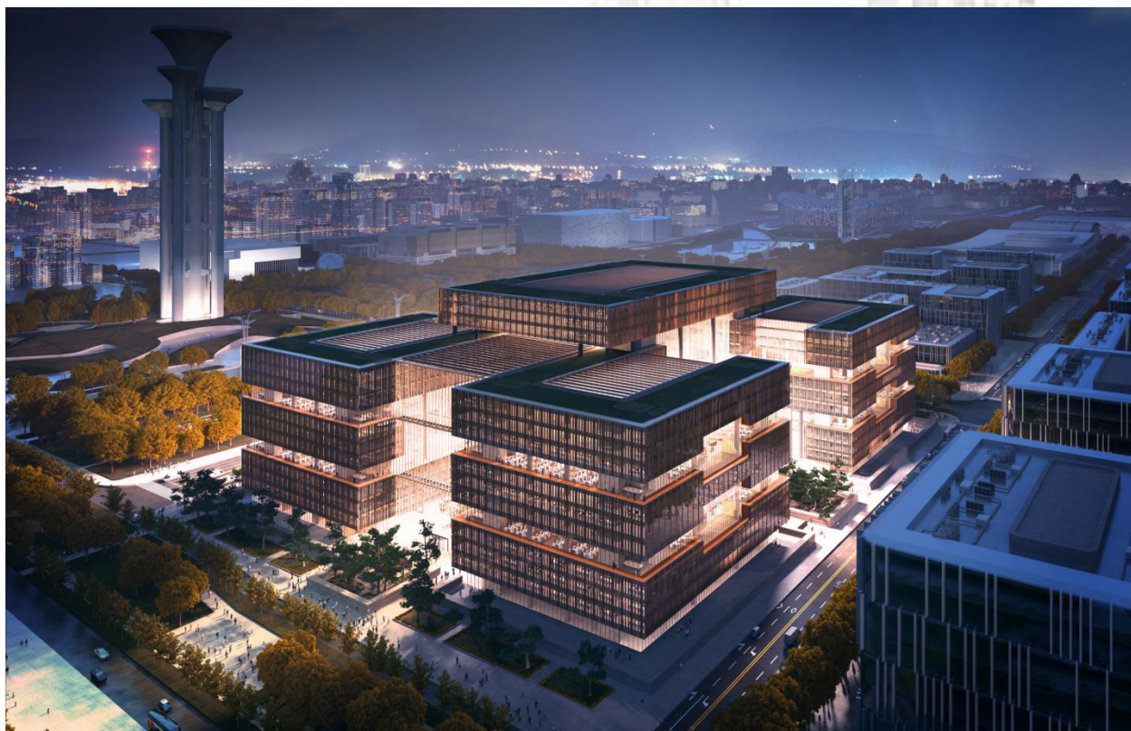
亚洲基础设施投资银行总部永久办公场所项目